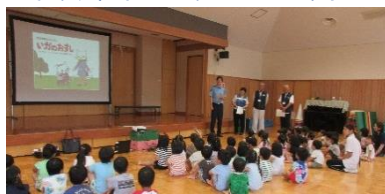
福井南警察署.ボランティア来園 (不審者対策.命の安全教育)